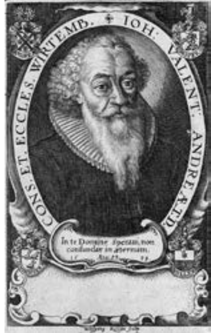
Afb. 2. Johann Valentin Andreae (kopergravure, 1639, Wolfgang Kilian; coll. Herzog August Bibliothek, Wolfenbüttel)

eerste instantie adviseren bij de redactie van zijn evangelieharmonie. De vriendschappelijke correspondentie nam snel een grote vlucht, alhoewel de twee ‘penvrienden’ elkaar nooit zouden ontmoeten. Beide zijden van deze briefwisseling zijn bewaard gebleven in de Herzog August Bibliothek en getuigen van hun vele gedeelde interesses: religie, politiek, literatuur, geschiedenis. 4 Naast de brieven wisselden zij regelmatig boeken, prenten en (autografe) tekeningen uit, maar ook kunstvoorwerpen en wetenschappelijke instrumenten. De correspondentie geeft bovendien een gedetailleerd beeld van hun uitwisseling van politiek-religieuze ideeën. Daarbij bedienden zij zich veelvuldig van geleerde Latijnse woordspelingen, emblematische inventies en dergelijke barokke gedachtenspelsels. Een voorbeeld bij uitstek