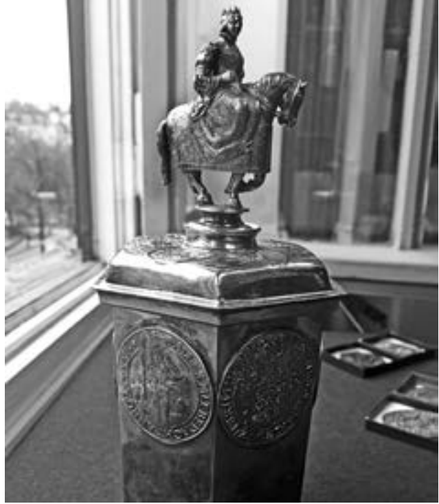
Afb. 3. Muntbeker vervaardigd naar ontwerp van Johann Valentin Andraea, circa 1645, met ruiterfiguur op het deksel, circa 1570-1580 ( verguld zilver; coll. Landesmuseum Württemberg, Stuttgart,)