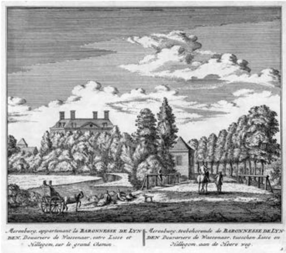
Afb. 1. Merenburg, gelegen aan de Heerweg tussen Lisse en Hillegom (gravure uit: Abraham Rademaker, Rhylands fraaiste gezichten; vertoonende alle deszelfs lustplaatzen, heerenhuizen en dorpen, Amsterdam, 1732, nr. 1)

Holland met een aantal van ongeveer 300 à 430 verreweg de meeste heerlijkheden telde, concurreerden de ongeveer 400 à 500 regenten er met tientallen edelen, met het hof en met de achttien stemhebbende steden om de honderden ambachten en heerlijkheden die in de loop van de zeventiende en achttiende eeuw in verkoop kwamen. 10