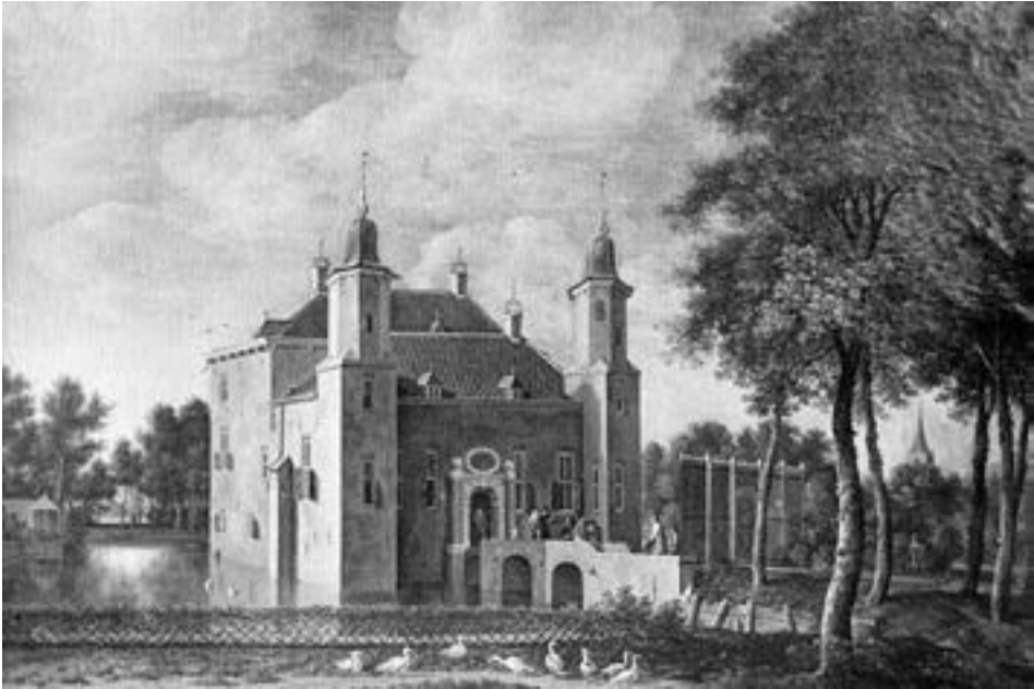
Afb. 5. Gezicht op kasteel Linschoten (fotoreproductie van een anonieme tekening, circa 1670)

Evenals zoveel andere coulissekastelen werd Linschoten als een gerieflijk landhuis op een classicistisch grondplan opgetrokken, maar voorzien van twee achthoekige torens met klokvormige spitsen, zodat het oogde als een waterslot. 50