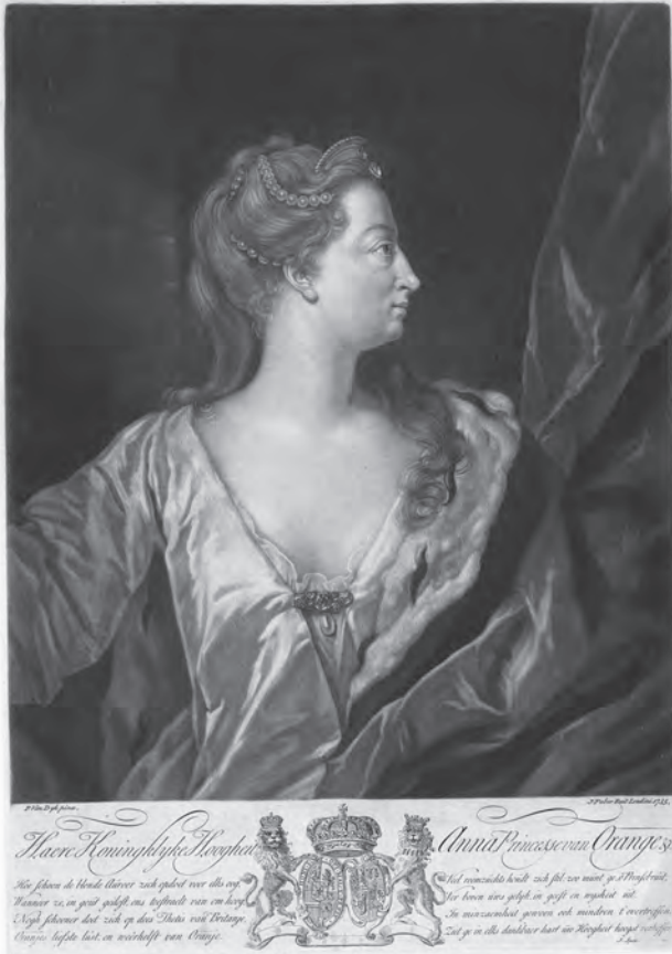
Anna van Hannover, prinses van Oranje-Nassau (1709-1759) (mezzotint, John Faber II naar Philip van Dijk, 1735;)