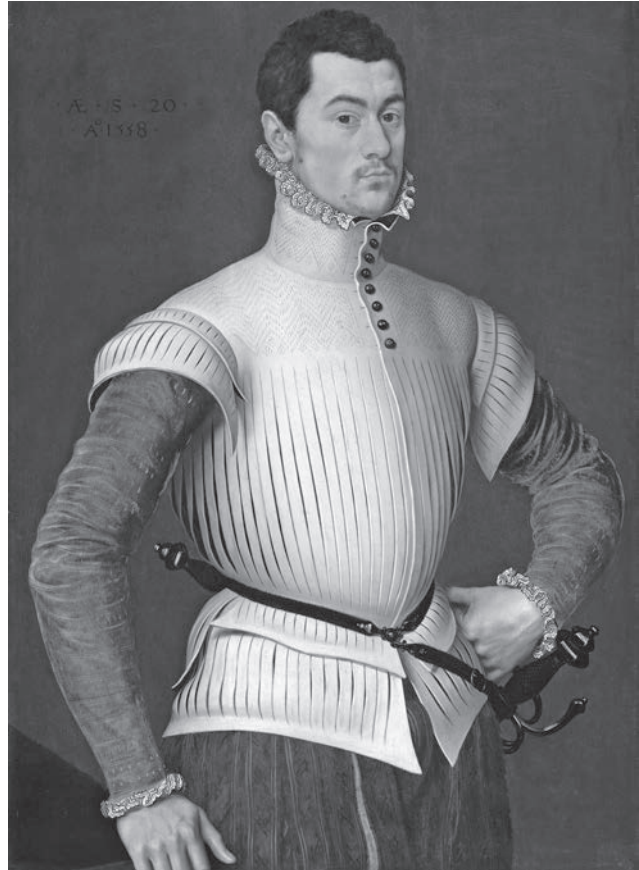
Willem IV van den Bergh (doek, Antonis Mor, 1558; coll. National Gallery of Art, Washington)