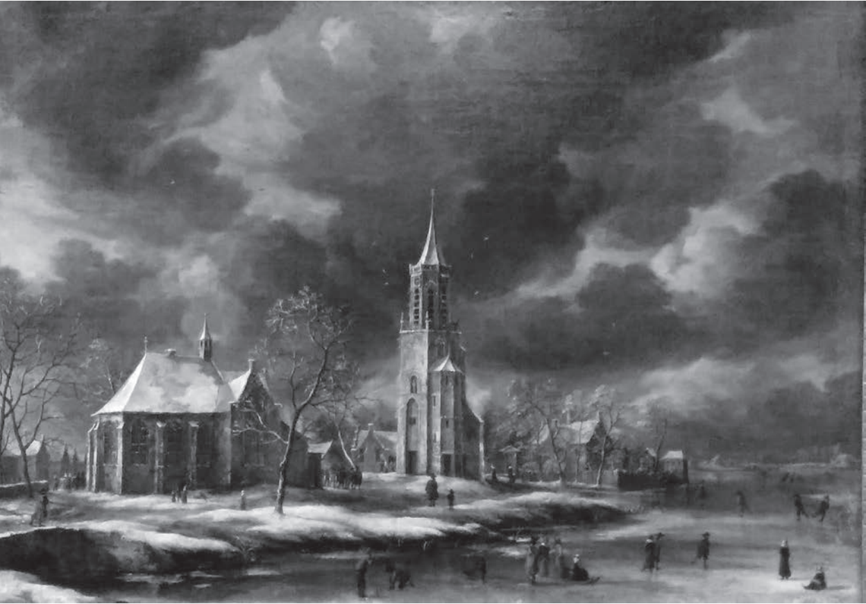
De kerk van Aarlanderveen (doek, Anthonie van Beerstraten, 1654-1666; coll. gemeentehuis Alphen aan den Rijn,)