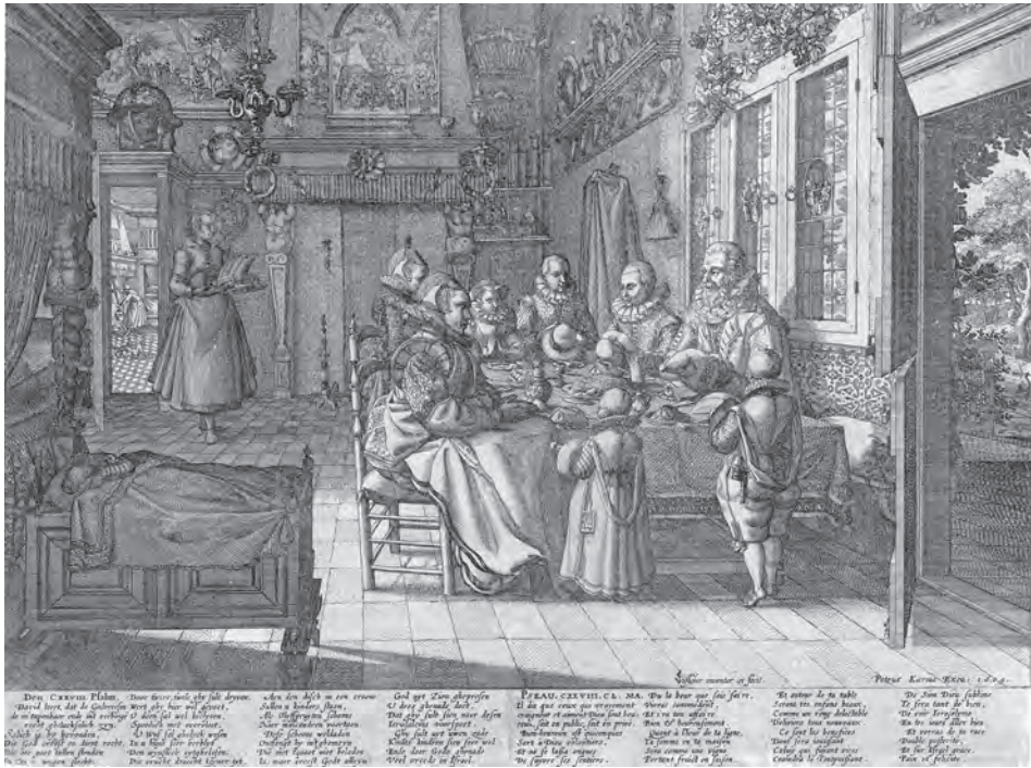
Gebed voor de maaltijd (gravure bij Psalm 128, Claes Jansz Visscher, Gent, 1609; coll. Rijksprentenkabinet, Amsterdam)

Uit boedelinventarissen is op te maken dat zeventiende-eeuwse Nederlanders hun ontbijtjes of banketjes vaak in de keuken hingen, maar soms ook in het voorhuis, de ontvangstruimte, de eetkamer of de kinderkamer. Was de kwaliteit wat minder, dan kwamen ze hoog aan de wand, boven een deur of boven de schouw. 9 Dit lijkt ook van toepassing op het Noordwijkse ontbijtje. De wisselvallige kwaliteit van het geschilderde noodt niet uit tot beschouwing van dichtbij. Opvallend is het contrast tussen de in gedekte tinten en soms wat onbeholpen afgebeelde spijzen op de achtergrond en de fel gekleurde, artistiek verantwoord en heraldisch onberispelijk geschilderde alliantiewapens op de voorgrond: een prominent en kleurrijk pièce de milieu tegen een ingetogen achtergrond van ‘Hollands welvaren’. 10