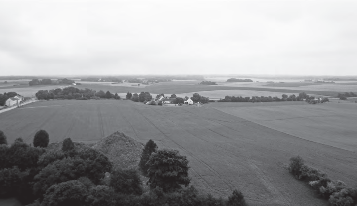
Uitzicht over het slagveld van Waterloo, 2014

teruggaat tot de onmiddellijke nasleep van de slag. De allereerste groep bezoekers bestond vooral uit personen die in de buurt van Brussel verbleven. Onder hen bevonden zich, behalve naburige bewoners, ook journalisten, diplomaten en familieleden van militairen die naar Brussel kwamen om hun geliefden op te sporen. 2 Het was echter slechts een kwestie van maanden totdat reizigers van verder weg kwamen om het slagveld te bezichtigen waarover ze zoveel hadden gelezen en gehoord. Waterloo groeide al snel uit tot een vaste reisbestemming op het continent. Blijkens de vroege opname van het slagveld in reisgidsen maakte Waterloo al enkele jaren na de slag deel uit van het gebruikelijke reispatroon bij een bezoek aan Brussel. 3