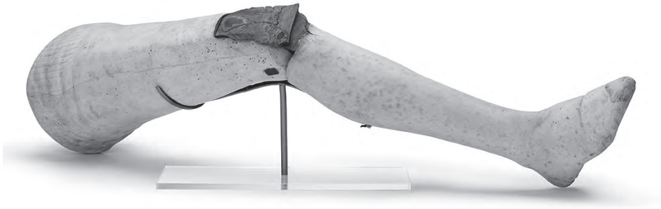
Een van de houten beenprotheses die zijn vervaardigd voor Henry Paget, Earl of Uxbridge, bevelhebber van de Britse cavalerie in de Slag bij Waterloo (foto Relic Imaging Ltd.; coll. The Household Cavalry Museum, Londen)