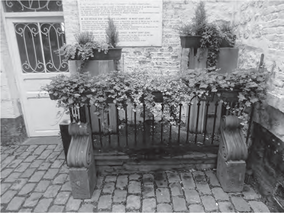
Het balkon van Victor Hugo uit Hôtel des Colonnes in de achtertuin van de hoeve van Caillou

se moed bleef in de negentiende eeuw weliswaar een belangrijke reden om naar het slagveld te reizen, maar de blijvende populariteit van het slagveld steunde ook in grote mate op mythevorming rond de romantische reizigers. Byron en Southey waren naar verluidt een van de eerste bezoekers die een krabbel hadden achtergelaten op de muur van de kapel van Hougomont. Volgens de populaire Engelse reisgids van John Murray (1836) waren de oorspronkelijke handtekeningen van de schrijvers nog steeds te bezichtigen. Veel bezoekers zouden het hen nadoen. Na verloop van tijd sierden ontelbare namen, data en adressen de gehele witte wand, waardoor de eigenaar volgens latere bezoekers werd genoodzaakt om de kapel elke vijf jaar opnieuw te witten. 63 Dezelfde reisgids bevatte ook luisterrijke citaten en weetjes over de beroemdheden, zoals de tocht van Byron te paard over het slagveld. 64