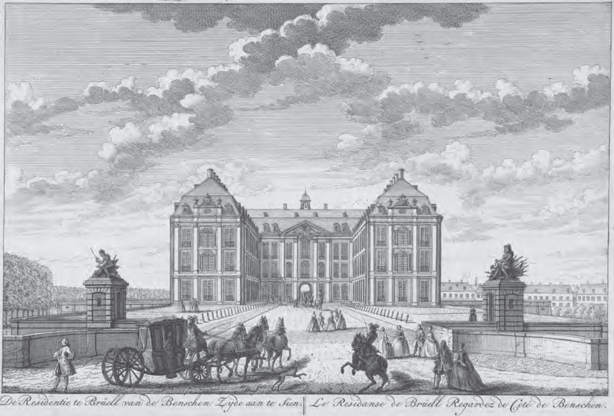
Slot Augustusburg te Brühl (gravure, H. de Leth. 1767, coll. Rijksmuseum Amsterdam)

ze interesse in chinoiserie was ook in andere tuinen zichtbaar. In het park van Schloss Sanssouci was bijvoorbeeld een Drachenhaus te vinden. De tuinen van Sanssouci waren deels in de landschapsstijl aangelegd. Van Hoorn was gecharmeerd van de tuinen die in verschillende stijlen en afmetingen waren ingedeeld en tezamen plaats boden aan een groot aantal tuinsieraden en tuingebouwen. Naast het Drachenhaus waren er tempels, een pantheon, een classicistisch belvédère en een verscheidenheid aan fontein en beelden te vinden. De formele tuinen van Schloss Charlottenburg deed Van Hoorn echter af als ouderwets. Hij had een duidelijke voorkeur voor de nieuwe landschapsstijl boven de barokke en formele tuin. 36