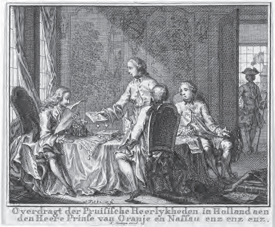
Overdragt der Pruisische Heerlykheden in Holland aen den Heere Prinse van Oranje en Nassau ( gravure , Simon Fokke, 1754; coll. Rijksmuseum, Amsterdam)