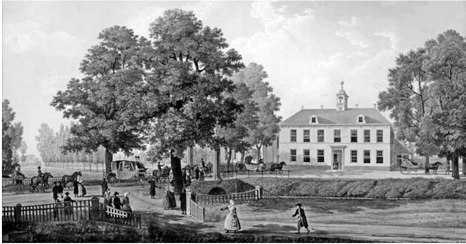
Huis te Zande in Hulsterambacht (aquarel, Antoine-Ignace Melling, 1812; afb. uit besproken boek, coll. Vereniging Oudheidkundige Kring De Vier Ambachten, Hulst)