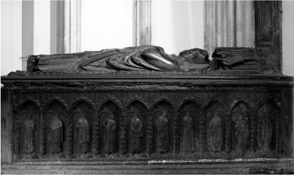
Lange zijde van de tombe van Gwijde van Avesnes (†1317) in de Avesneskapel van de Domkerk te Utrecht. Op de wanden van de tombe zijn in totaal veertien pleurants afgebeeld