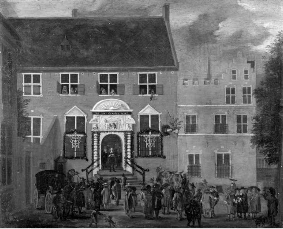
Afkondiging van het nieuwe regeringsreglement te Utrecht in 1674 (doek, anonieme Noord-Nederlandse schilder, 1674; coll. Centraal Museum Utrecht)