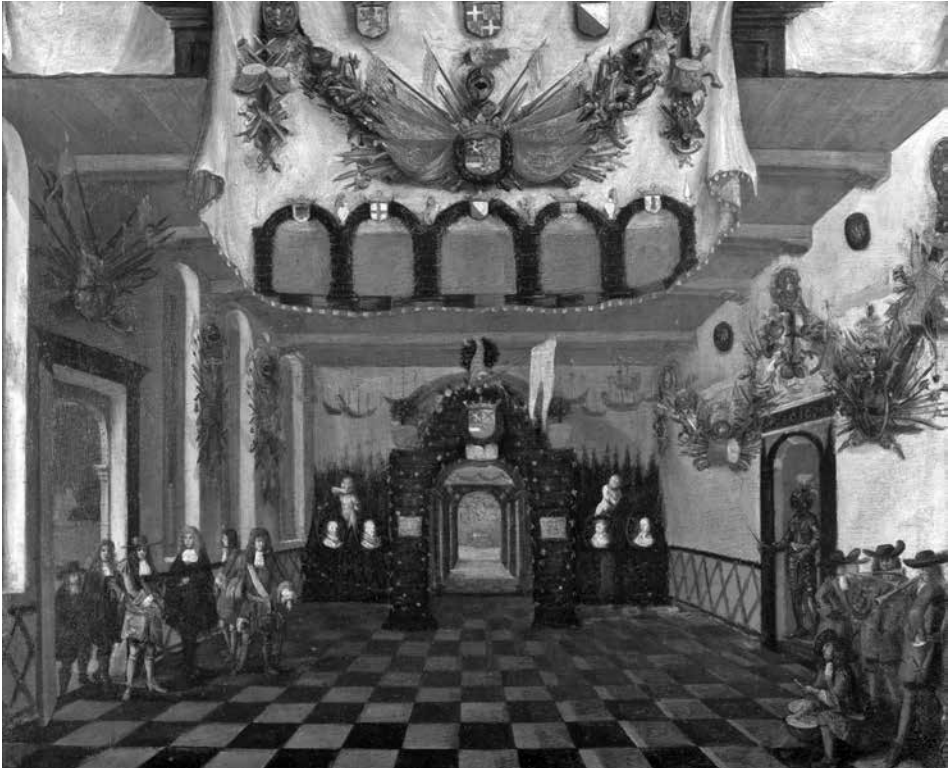
Ontvangst van Prins Willem III in 1674 in de Statenkamer van Utrecht ter gelegenheid van zijn aanstelling tot erfstadhouder (paneel, anonieme Noord-Nederlandse schilder, 1674; coll. Centraal Museum Utrecht)