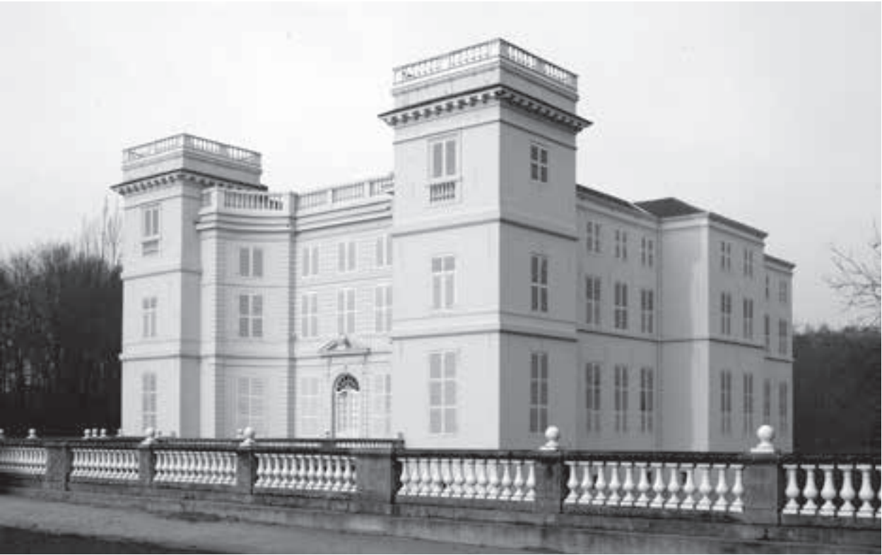
Het Kasteel d'Ursel te Hingene, provincie Antwerpen

ecologische en economische uitdagingen. Dat een en ander natuurlijk ook gericht is op het aantrekken van bezoekers, is een verexcuseerbare evidentie.