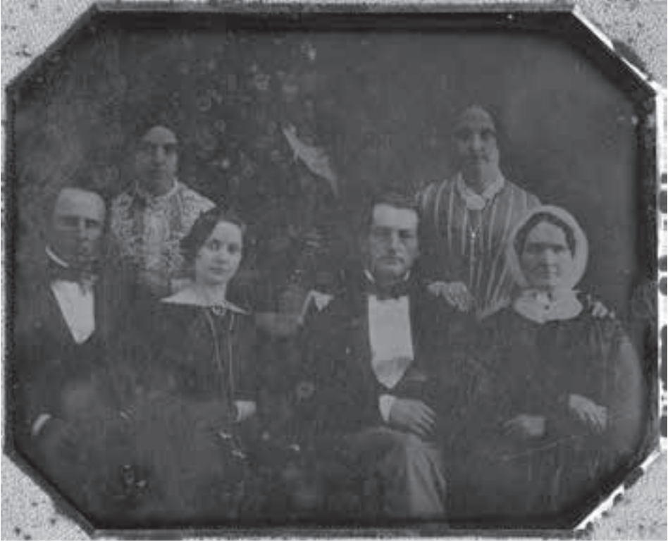
Het echtpaar Fanny Kemble 1809- 1893 en Pierce Butler 1806- 1867, jaren veertig van de negentiende eeuw. De kritiek van de Engelse actrice op de manier waarop Pierce Butler met zijn slaven omging was een van de voornaamste redenen waarom het tot een breuk kwam tussen de echtgenoten ( daguerreotype ;)

stabiele elite, maar een zeer dynamische. Maar die dynamiek weerhield de planters er niet van zich in te zetten om beschaafde aristocraten te worden: 'In a few years owing to the operation of this institution (slavernij WV) [...] we shall be the richest people beneath the bend of the rainbow, and then the arts and sciences, which always follow in the train of wealth, will flourish to an extent hitherto unknown on this side of the Atlantic,' aldus The Southern Ladies' book in 1840. 50