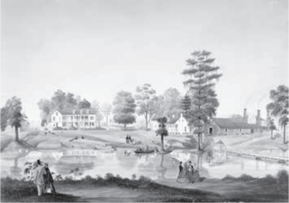
Oliver Sugar Plantation, Louisiana ( gouache en collage op papier, Marie Adrien Persac, 1861; coll. Louisiana State Museum, New Orleans )

splendid peculiarities of tropical scenery. In the Hotel [in Maryland, de meest noordelijke slavenstaat, WV], I saw only decent looking waiters and house-maids, [...] distinguishable from European servants by nothing but colour. 74 Dat die huisslaven met hun meester werden afgebeeld, interpreteert Simon Gikandi als het benadrukken van het aristocratische gehalte van de meester tegenover de kleine blanke Amerikaanse boer, die immers zijn huishouden zonder huisslaaf moest zien te rooien. 75 De huisslaaf benadrukte dus de status van eigenaar aan de top van de sociale hiërarchie in Amerika, terwijl die huisslaaf ook minder weerzin opwekte bij een internationaal publiek dan de Afro-Amerikaanse arbeider. Op menig Europees portret van adellijke heren en dames, op het kasteel Cannenburgh hangen enkele voorbeelden, was een slaaf als ornament immers geen onbekende. 76