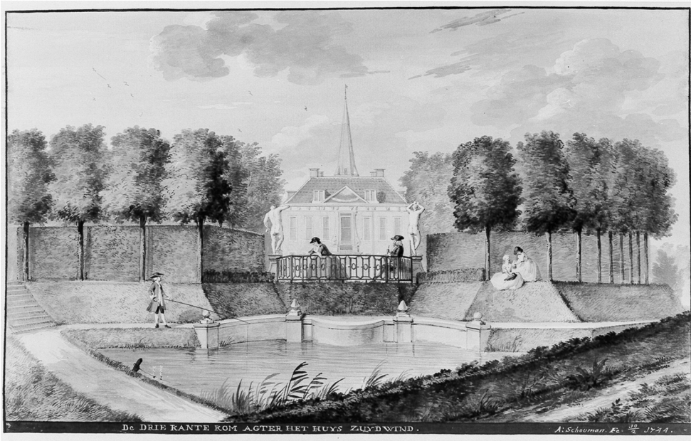
Achterzijde met de 'Driekante Kom' van de buitenplaats Zuidwind bij 's-Gravenzande (tekening, Aart Schouman, 1744; part. coll.)

die van de deugd, in welke hoedanigheid hij een wezenskenmerk van de adel verbeeldde. Het is niet bekend of dit beeld er al stond toen Hendrik de buitenplaats erfde, maar zeker is wel dat het goed aansloot bij de adellijke status die hij wilde uitstralen. 16