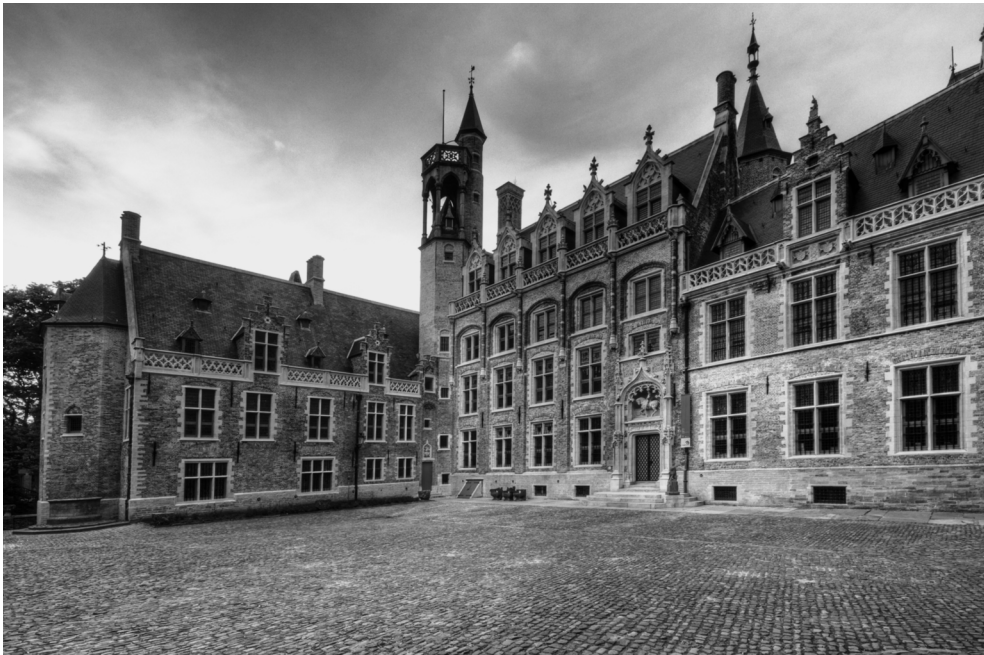
Stadspaleis van de familie Van Gruuthuse te Brugge

vijftiende en zestiende-eeuwse Orléanais en Maine. Het aantal families dat tussen 1400 en 1600 via stedelijke ambten adeldom verwierf, steeg weliswaar van 10 tot 27 procent, maar het meest gevolgde nobiliteringspatroon (18 tot 37 procent) was dat van de gentilshommes campagnards die volgens de adellijke levenswijze op het platteland woonden. De overgrote meerderheid van de adel gaf er bovendien de voorkeur aan om op het platteland te wonen, alleen edelen actief in bestuursambten woonden in de stad. De kansen voor bewoners van het platteland om geleidelijk adeldom te verwerven varieerden en waren afhankelijk van de regionale verschillen in sociaal-economische structuren, zoals de bedrijfsgrootte, en instituties, zoals het leenrecht. In Maine waren deze omstandigheden ongunstig, waardoor vanaf de zestiende eeuw vrijwel alleen notabelen uit de stad via een bestuurlijke carrière sociale opgang maakten.