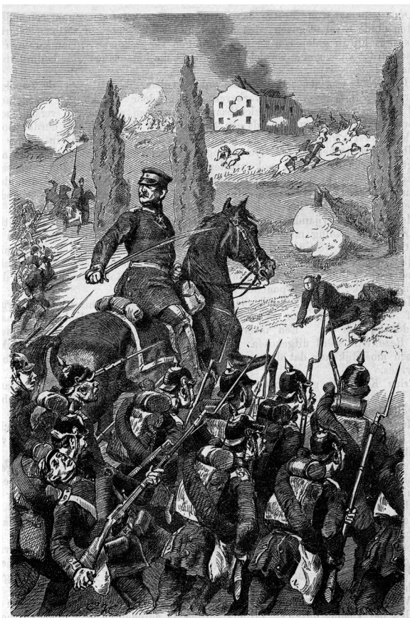
Een episode uit de Frans-Duitse oorlog: de Slag bij Gravelotte op 18 augustus 1870 (uit: Werner Hahn, Deutschland's krijg tegen Frankrijk, Doesburg, 1871 )

verdedigbaar was. Tijdig gestelde inundaties waren een effectief middel om de vijand tegen te houden. 1 Veel militaire auteurs voegden daar echter waarschuwend aan toe dat Nederland wel een groot deel van de Duitse militaire succesformule diende te kopiëren, om de macht van het door Bismarck gecreëerde keizerrijk te kunnen weerstaan. Daarom vormde na 1870 het militair superieure Duitsland voor veel Nederlandse officieren niet alleen een geduchte bedreiging, maar ook een lichtend voorbeeld dat navolging verdiende. 2