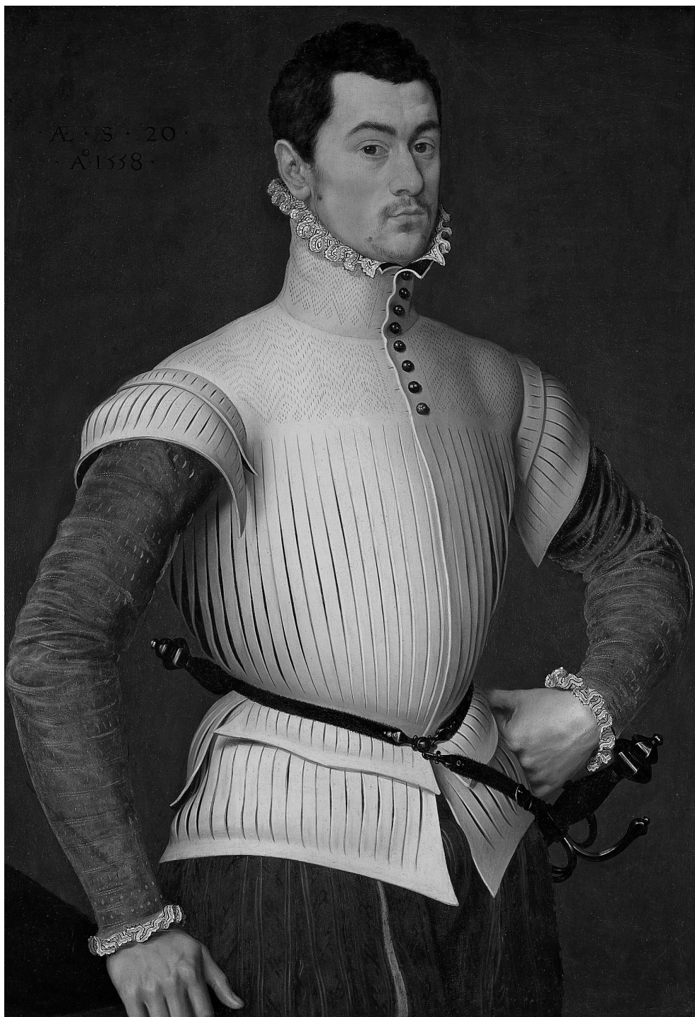
Graaf Willem van den Bergh op twintigjarige leeftijd, 1558. Toegeschreven aan Anthoni Mor van Dashorst (paneel; National Gallery of Art, Washington)