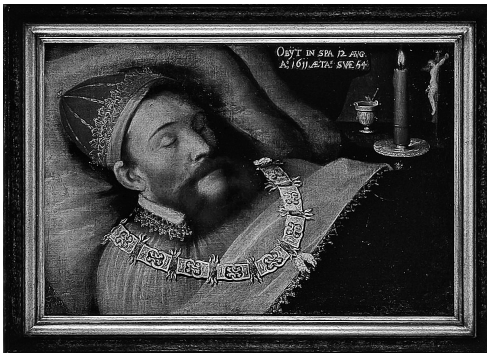
Graaf Herman van den Bergh op zijn doodsbed in Spa, 1611 (paneel; Stichting Huis Bergh, 's-Heerenberg)