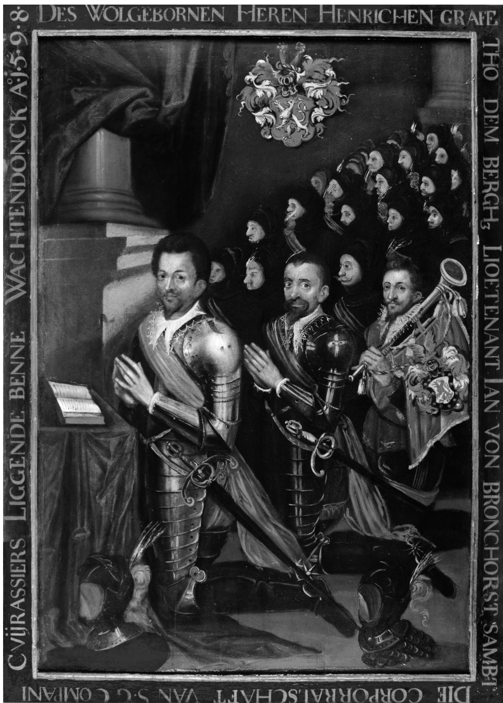
Gedenkpaneel uit 1598 van Hendrik van den Bergh met zijn luitenant Jan van Bronckhorst en hun kurassiers in Wachtendonk, waar zij in dat jaar enige tijd waren gelegerd. Het schilderij suggereert dat Hendrik toen al tot het katholicisme was overgegaan (paneel; Katholisches Pfaramt, Wachtendonk)