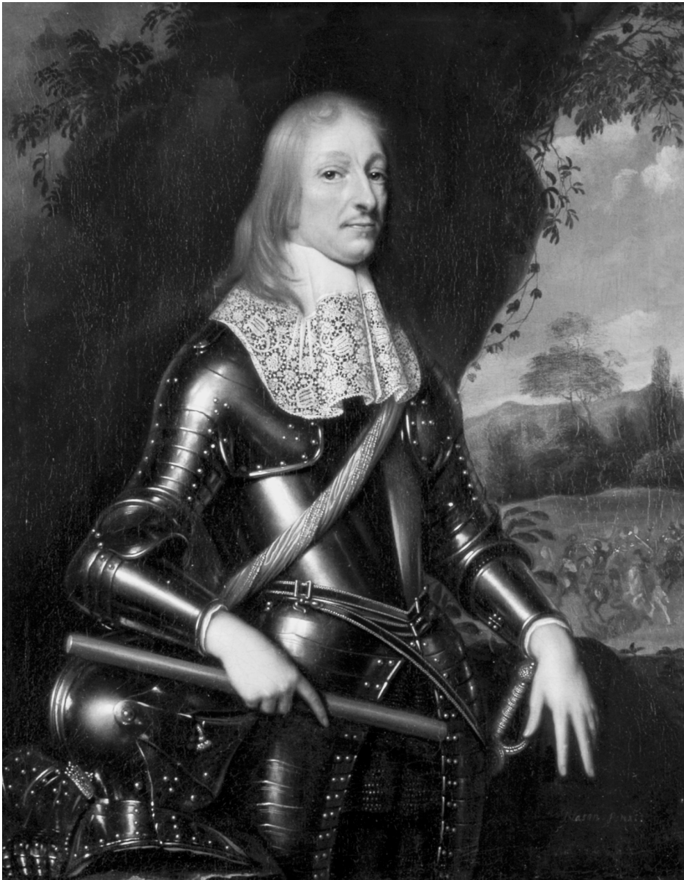
Stadhouder Willem Frederik van Nassau-Dietz (1613-1664) (doek naar een portret door Andriaen Hanneman; Pieter Nason, 1662;)