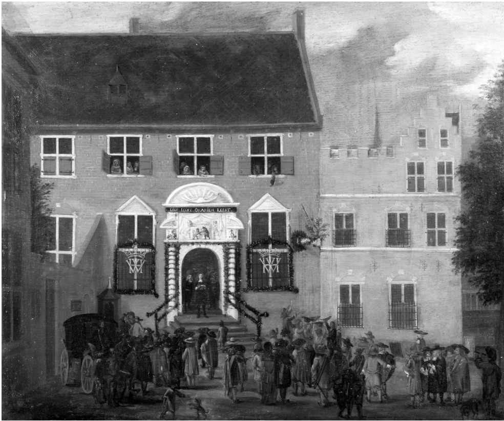
De Statenkamer met rechts het ridderschapshuis aan het Janskerkhof te Utrecht tijdens de afkondiging van het nieuwe regeringsreglement in 1674 (paneel; 1674; coll. Centraal Museum, Utrecht)

( Deutschmeister ), de belangrijkste man na de grootmeester ( Hochmeister ), die sinds 1309 resideerde op de Marienburg in Pruisen.