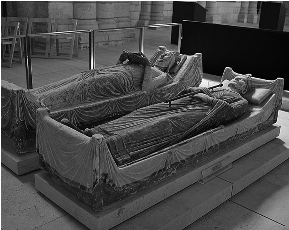
De gisents in de abdijkerk van Fontevraud in Frankrijk. Eleonora van Aquitanië en haar man Hendrik II Plantagenet, hertog van Anjou en koning van Engeland (foto, particuliere collectie)

Op één gebied manifesteren middeleeuwse dames zich minstens zo prominent als hun heren: de memorie- en beeldcultuur. Het oudste bewaarde adelsportret in de Hollandse geschiedenis is zelfs een dubbelportret: de bekende schenkingsminiatuur van graaf Dirk II en gravin Hildegard in het Egmondse evangeliehandschrift. Duby wijdt het leeuwendeel van zijn boek aan de ‘nagedachtenis van de moeders en de grootmoeders’. Hij begint in de abdijkerk van Fontevraud, waar Eleonora van Aquitanië in 1204 naast haar tweede man Hendrik (II) Plantagenet is bijgezet. Zij ligt er als gisante levensgroot en in volle kleuren bij, schijnbaar verdiept in een boek. In de graf- en memoriecultuur van de middeleeuwse Noordfranse en Vlaamse hoge adel gaven vrouwen volgens Duby de toon aan. ‘Net als de lichamen van pasgeborenen behoorden de lichamen der overledenen de vrouwen toe’, schrijft hij, en: ‘De twee functies van de vrouw, de moederlijke en de begravinge, maakten [...] de edelvrouw