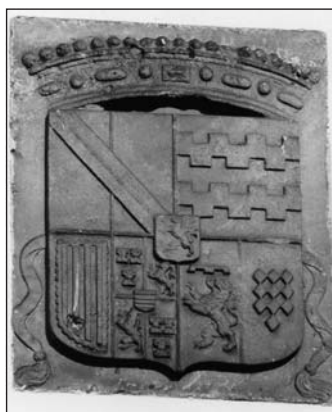
Wapensteen Van Eck-Quadt van Wickeradt, ingemetseld in het bouwhuis van het voormalige kasteel Groenewoude. Hardsteen, 62 x 57 cm.

Van de ridderhofstad Groenewoude onder Woudenberg resteren een bouw- of koetshuis en een toegangshek. In het landschap zijn ter plaatse slechts vaag de contouren zichtbaar van de plek waar tot het midden van de negentiende eeuw het van oorsprong veertiende-eeuwse kasteel heeft gestaan. De gebouwen op de voorburch, zoals een poortgebouw en een koetshuis, maakten in 1696 plaats voor het huidige bouwhuis. Dit is althans af te leiden uit een sluitsteen met wapen en jaartal, die in de oostelijke lengtegevel boven de poortdeuren is aangebracht. Het wapen vertoont in goud drie zwarte