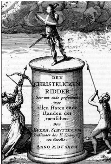
Titelpagina van Den christlicken ridder van de Zwolse predikant Everhardus Schuttenius

offensief dat vooral de gereformeerde kerk in de eerste decennia van de zeventiende eeuw lijkt te hebben gevoerd tegen in haar ogen onchristelijke elementen van de traditionele adelscultuur. 62 Deze ontwikkelingen leidden niet alleen tot een vermindering van impulsief eergeweld, maar ook tot een scherpe daling van voorheen wijdverspreide verschijnselen als concubinaat en bastaardij. Nauw verbonden met deze mentaal-culturele veranderingen was de inpassing van de in de ridderschap verschreven adel in het staatsbestel van de Republiek, waardoor zich tradities van ambtsvervulling en dienst aan de staat konden vormen en verscheidene families in de achttiende eeuw ten slotte zouden worden opgenomen in een zich vormende nationale elite. Mede door de voortdurende oorlogvoering op het platteland en de gedwongen, soms decennialange, abstinente van vele riddermatige geslachten uit de ridderschapscolleges tijdens de Opstand duurde het in de oostelijke gewesten betrekkelijk lang voordat etatistische noties zich konden doorzetten.