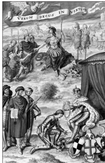
Titelplaat van het Wapenboek der Riddermatige Quartieren van de Heeren van de Ridderschap der Graafschap Zutphen door B. Barkhuijs, 1707