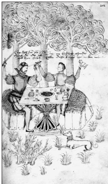
Tekening uit het ‘Overijssels Liedboek’, tweede helft zestiende eeuw