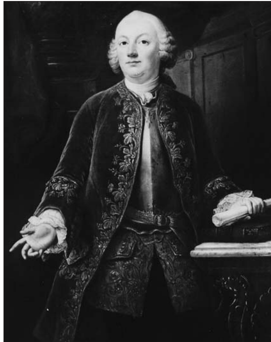
Onno Zwier van Haren, door J. Fournier, 1752 (doek)

eeuw werd in Friesland een handig boekje uitgegeven vol met cynische ‘tips’ voor ambitieuze lieden die maatschappelijk omhoog wensten te komen: De politycke kuyper onses tydts . Om bij een edelman in het gevele te komen moest men ‘ydele ende windige inbeeldingen, hol ende bol als een Balon, nochmeerder op [te] blasen, ende hem in de lucht te doen vliegen’. Daartoe hoefde men slechts ‘s mans oude adeldom hogelijk te prijzen en over zijn roemruchte voorgeslacht te verhalen. Vleiers dienden zich als de ‘Fransche Complimenteurs’ zeer onderdanig te gedragen en konden de macht van hun beoogde patroon niet genoeg overdrijven. 19