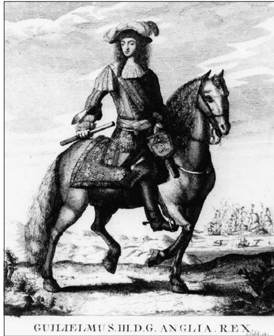
Stadhouder-koning Willem III (kopergravure; foto Iconogra- fisch Bureau, Den Haag)

hofleven. Onder stadhoudelijke leiding ontwikkelde zich het meest uitgebreide stelsel van neerdalende macht in de Republiek. Het werd in een aantal fasen op- en uitgebouwd, aanvankelijk op basis van persoonlijke giften voor betoonde loyaliteit. Lieuwe van Aitzema bezag deze stadhoudelijke politiek positief en betreurde de vroege dood van Willem II. Had deze stadhouder langer kunnen leven, hij 'soude in grootheyt ende aensien hebben toegenomen. Hij was, aldus Van Aitzema, mild en genereus, hetgeen hij 'met geven van subsidien ende pensioenen' aan velen betoonde. 36