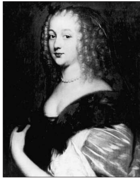
Rechts: (Waarschijnlijk) Amelie Margaretha van Brederode ( paneel )