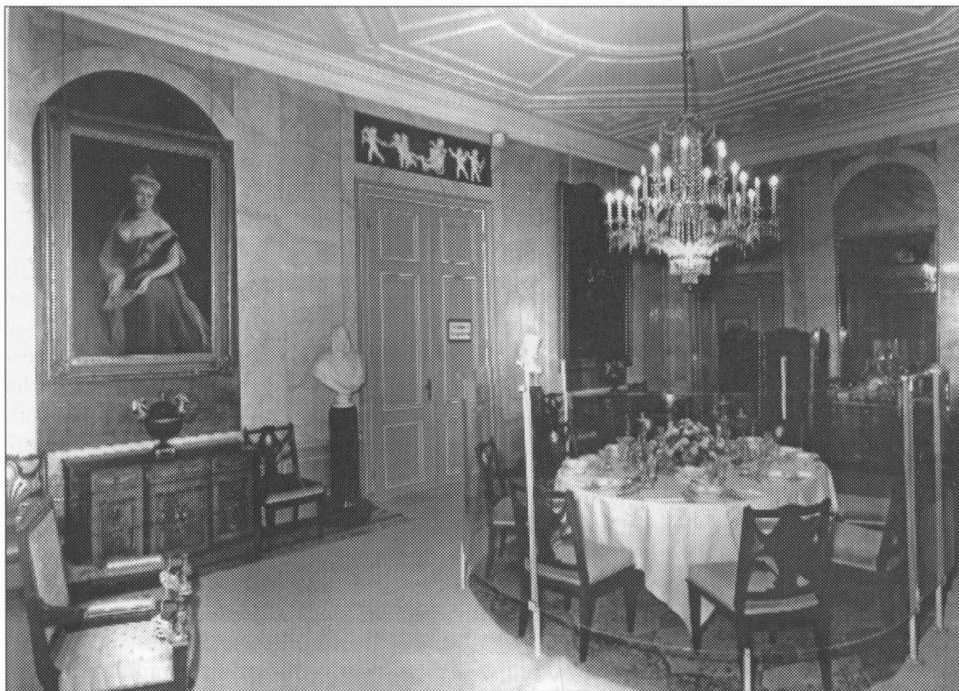
Huis Doorn, interieur eetkamer voorheen 'Sallon', in neo-classicistische stijl ontworpen door B.W.H. Ziesenis en A. van der Hart.

Wilhelm II overging. Nadat diverse verbouwingen waren uitgevoerd werd het huis op 14 mei 1920 betrokken door het keizerlijk paar en een kleine hofhouding.