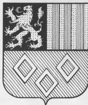
Wapen van Glymes. Het schild is het wapen van Glymes 'nieuwe stijl': het eerste kwartier is van gelijke grootte als het tweede. Pentekening door Br. Paulus van Mansfeld, 1977.