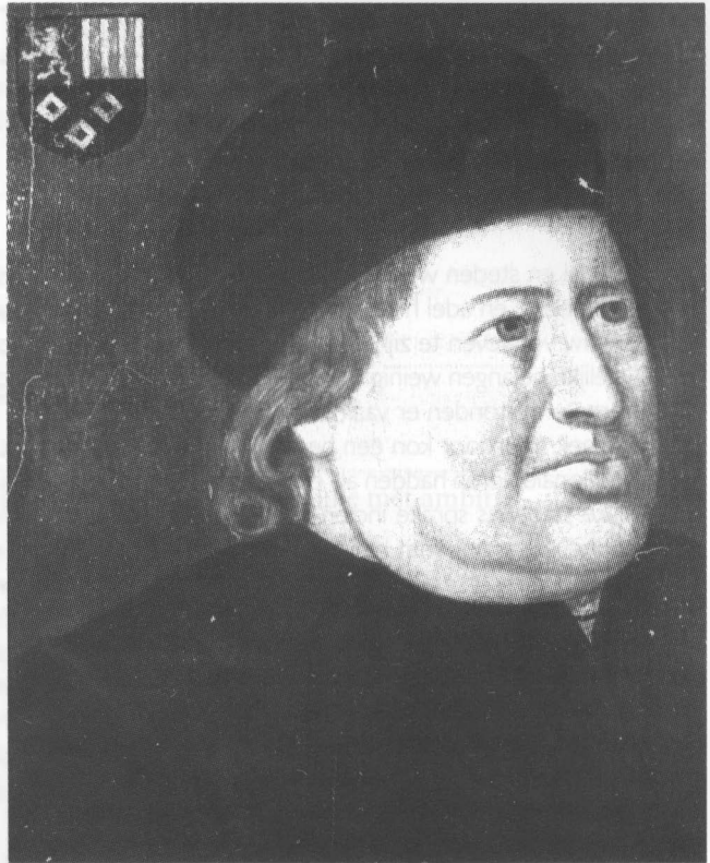
Jan II van Glymes, heer van Bergen op Zoom (1417-1494). Paneel, zeventiende-eeuwse kopie uit het stadhuis van Bergen op Zoom naar een verloren gegaan origineel. (Gemeentemuseum Het Markiezenhof, Bergen op Zoom;)

De eerste leden van het geslacht Glymes van Bergen op Zoom voerden het hertogelijke wapenschild met de Brabantse leeuw, waar overheen een schuinstreep als teken van bastaard-