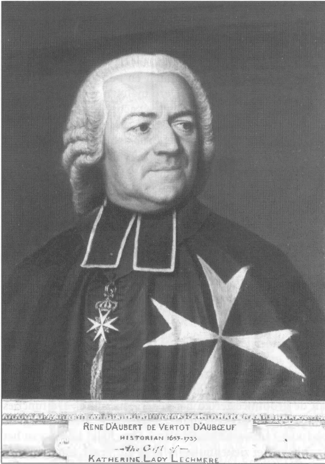
Portret van de Abbé de Vertot, historicus van de maltezers (museum van St John's Gate, Londen).

Dit Duitse veldhospitaal werd al in 1191 onder bescherming van de paus gesteld en kreeg weldra een vaste standplaats in Akko. Later, toen het Heilige Land definitief voor de kruisvaarders verloren was gegaan na de val van Akko in 1291, heeft de Duitse orde zijn werkterrein grotendeels naar Pruisen verplaatst, waar de onderwerping en kerstening van de Slavische volkeren zijn hoofdoel werd en de Marienburg aan de Weichsel, niet ver van Danzig, zijn hoofdkwartier. Door de Duitse orde zijn in veel steden van het Duitse Rijk ziekenhuizen of althans gasthuizen gesticht, want ook hier versmalde zich de ziekenzorg al vrij snel tot zorg voor doortrekkende reizigers. 9