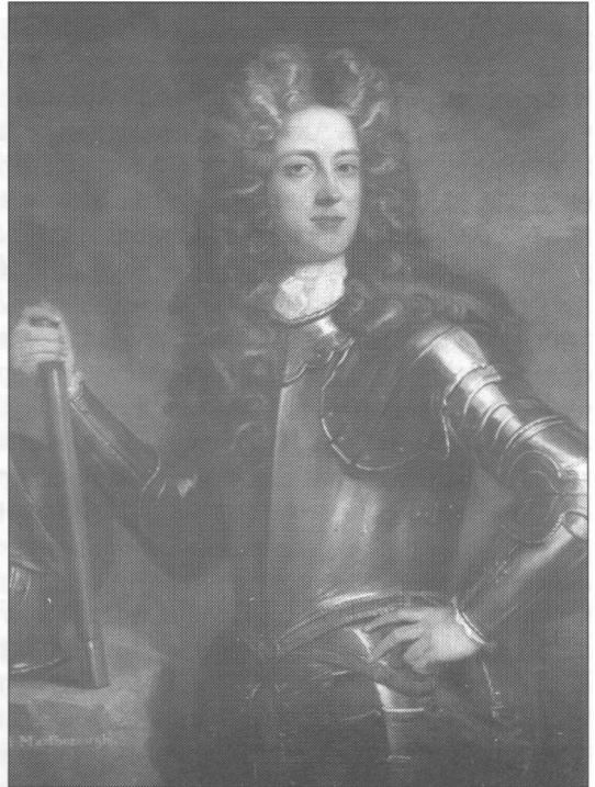
John Churchill, hertog van Marlborough door G. Kneller