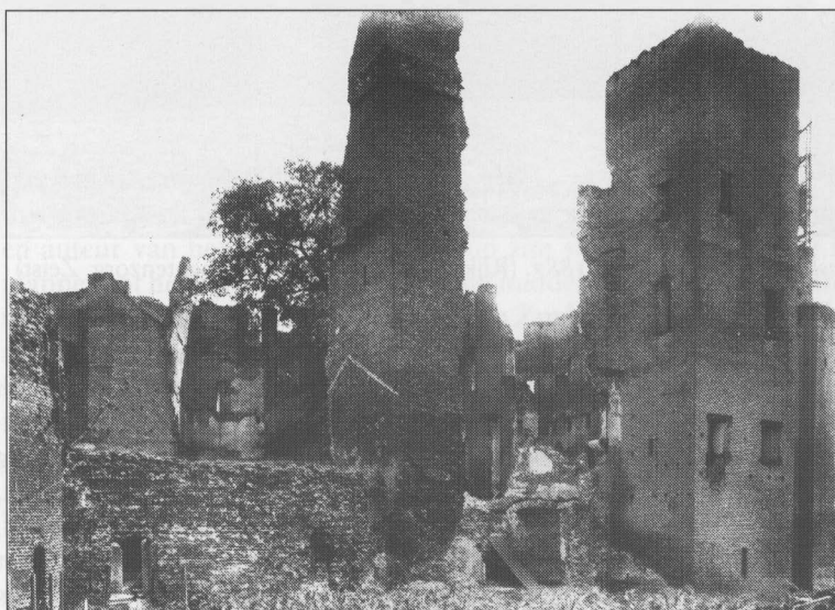
De ruïne van het middel- eeuwse kasteel De Haar in 1887, waarbij de oorspronkelijke ingang wordt aangegeven door een loopplank.