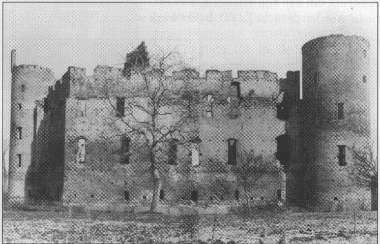
De achterzijde van de ruïne in 1887.

Een ander buitenverblijf van de Rothschilds was Waddesdon Manor. In 1874 kocht Ferdinand baron de Rothschild van de hertog van Marlborough de landgoederen Waddesdon en Winchenden in Buckinghamshire en liet hij door de Franse architect Gabriel-Hippolyte Destailleux een enorm buiten ontwerpen dat de sfeer van de Franse renaissance uitstraalde. Het resultaat was Waddesdon Manor (1874-1879). De kale en winderige heuvel waarop het grote kasteel in gele Bathsteen werd opgetrokken, werd met honderden volgroeide bomen