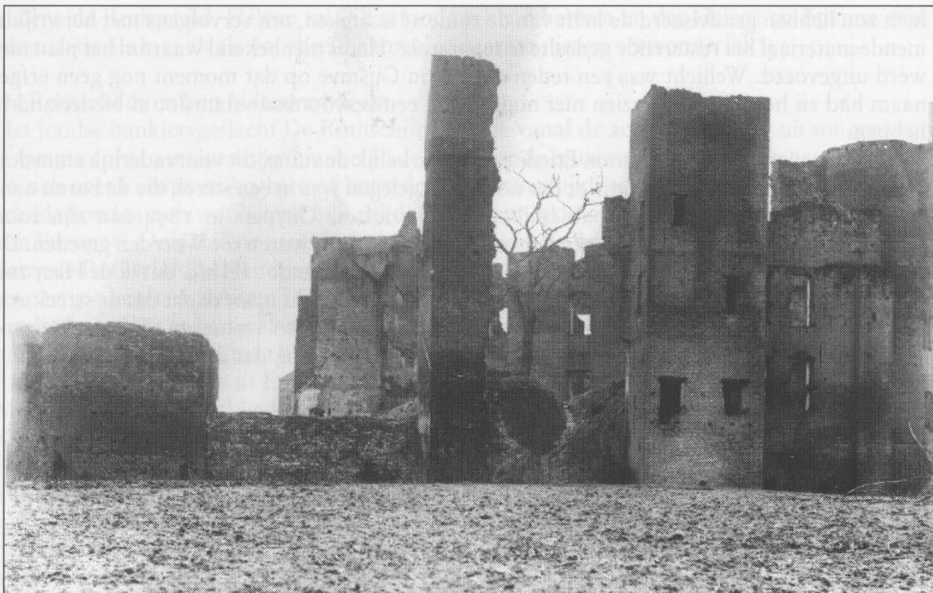
De ruïne van het middeleeuwse kasteel De Haar in 1887.