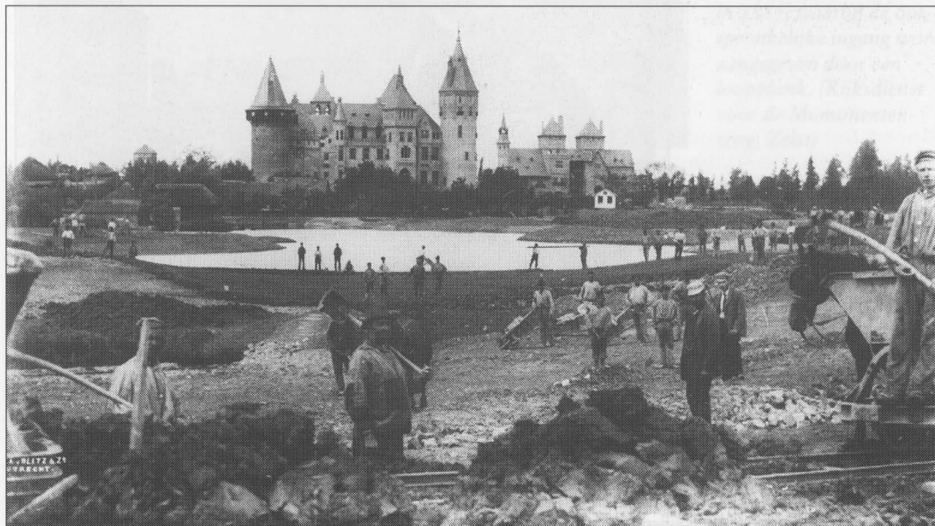
Het herstel van het kasteel is omstreeks de eeuwwisseling al ver gevorderd. Tevens is een begin gemaakt met de aanleg van de tuinen en het park.

Een aantal keren wordt in de bronnen het belang van status en aanzien benadrukt. Zo werd bijvoorbeeld, lang nadat de ruïne hersteld was, geschreven over een zeker moment voor de restauratie, toen baron Etienne nog 'slechts' de bezitter van een ruïne was: 'O, wat hadden zijn vrienden in Frankrijk hem daarmee geplaagd! Zij, die zulke schitterende landhuizen bezaten, het eene al mooier dan het andere. En hij, hij bezat slechts een ruïne. Wacht maar, had hij gezegd, eens zal de tijd komen, dat gij mijn gasten zult zijn op mijn kasteel!' 14 . Toen dan eindelijk met het herstel van het kasteel werd aangevangen, moet het voor Etienne van Zuylen heerlijk zijn geweest om vol trots te kunnen vertellen dat hij een groots landgoed in Nederland bezat: 'Het was voor den landheer, die meest in Parijs en Nizza (=Nice) verbleef, bijzonder aantrekkelijk om aan zijn vrienden in Frankrijk duidelijk te kunnen maken, waar zijn riddersgoed moest worden gezocht [...]' 15 . In het werk waaruit bovenstaande citaten afkomstig zijn, memo-