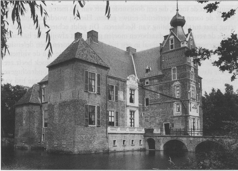
De Cannenburgh

rende uit het tweede kwart van de zestiende eeuw. 19