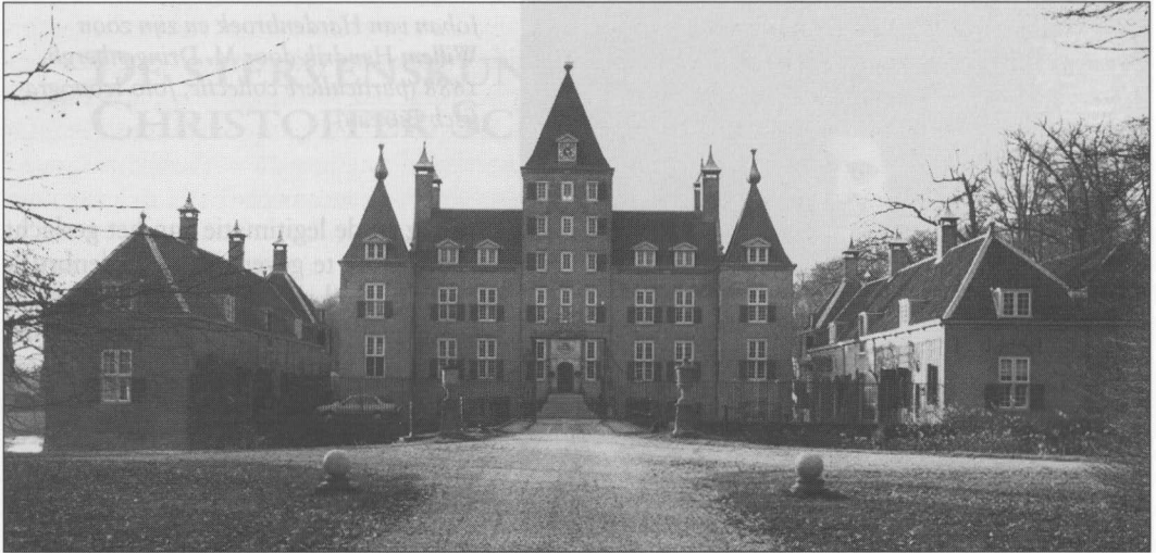
Kasteel Renswoude