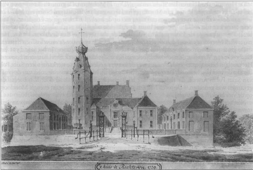
Huis Rechteren door Abraham de Haen, 1729. Op de tekening is halverwege de toren te zien van waaraf de veertiende-eeuwse toren in 1634 werd verhoogd (Collectie Gemeentearchief Arnhem, foto Rijksdienst voor de Monumentenzorg)

recentere datum te zijn. We gaan er voorlopig van uit dat de verhoging van de toren waarschijnlijk in de zestiende, of mogelijk zelfs in de tweede helft van de vijftiende eeuw plaats zal hebben gevonden. Een ingrijpende restauratie biedt wellicht de mogelijkheid deze datering te bevestigen of te weerleggen.