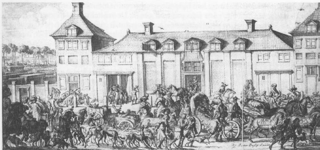
Romeyn de Hooghe, Linker gedeelte van een driedelige gravure van de thuiskomst van een jachtstoet op Het Loo.