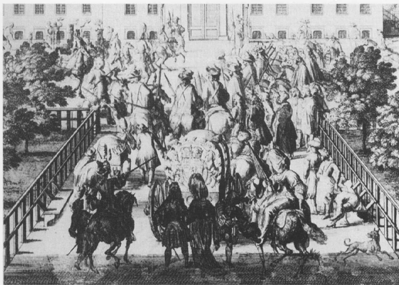
Romeyn de Hooghe, Aankomst van koning Willem III bij het Hof te Dieren, 18 maart 1691.