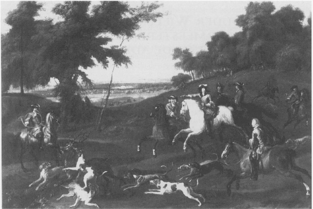
Dirk Maas, Willem III tijdens de bertenjacht (Rijksmuseum Paleis Het Loo)