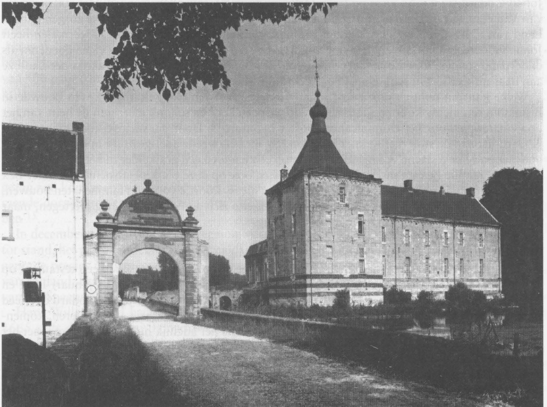
Kasteel Genhoes