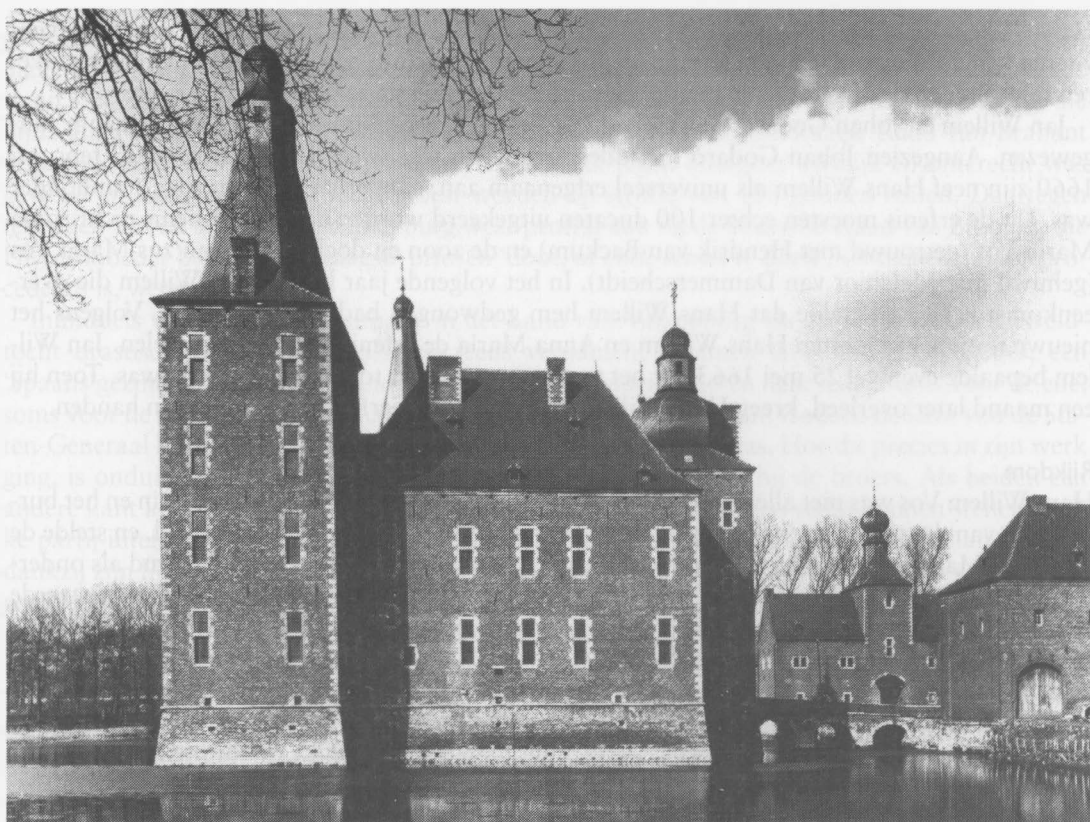
Kasteel Hoensbroek