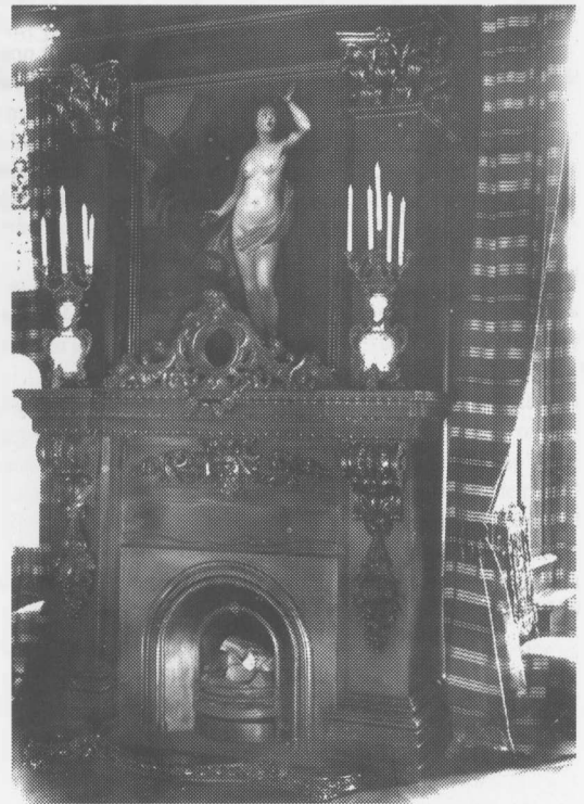
De eetkamer in het kasteel Rechteren bij Dalfsen aan het einde van de negentiende eeuw. Als schoorsteenstuk is gebruikt het schilderij van Andromeda door Hendrik ten Oever uit 1698.

Het verhaal van Andromeda speelde zich af in de Griekse Oudheid. Zij was een dochter van Cepheus en Cassiopeia. Cepheus' dochter meende dat zij mooier was dan de Nereïden, vriendelijke zeenimfen die de schippers hulpvaardig bijstonden. Poseidon, de god van de zee en het water, zond een zeemonster om het land van Cepheus te teisteren. Alleen wanneer Andromeda opgeofferd zou worden aan het monster zou aan de rampen een einde komen. Andromeda werd aan een rots geketend om haar gruwzame lot af te wachten. Het is deze scène, die Ten Oever afbeeldde. Maar Perseus, één van de glorierijke Griekse helden, wist het monster te verslaan. Daarna kon hij Andromeda huwen en zij werden de stamouders van vele beroemde en dappere helden. Op zinnebeeldige wijze wordt in de voorstelling verwezen naar de rol van Willem III (Perseus) en zijn vrouw Mary (Andromeda) tijdens de 'Glorious Revolution' van 1688. Opvallend is ook, dat in latere tijd dit verhaal een christelijke uitleg kreeg, met een verwijzing naar het verhaal van Sint Joris en de draak. Vooral in Engeland raakte deze geschiedenis ingeburgerd en Sint Joris werd overigens de schutspatroon van dat koninkrijk en van de in 1344 ingestelde